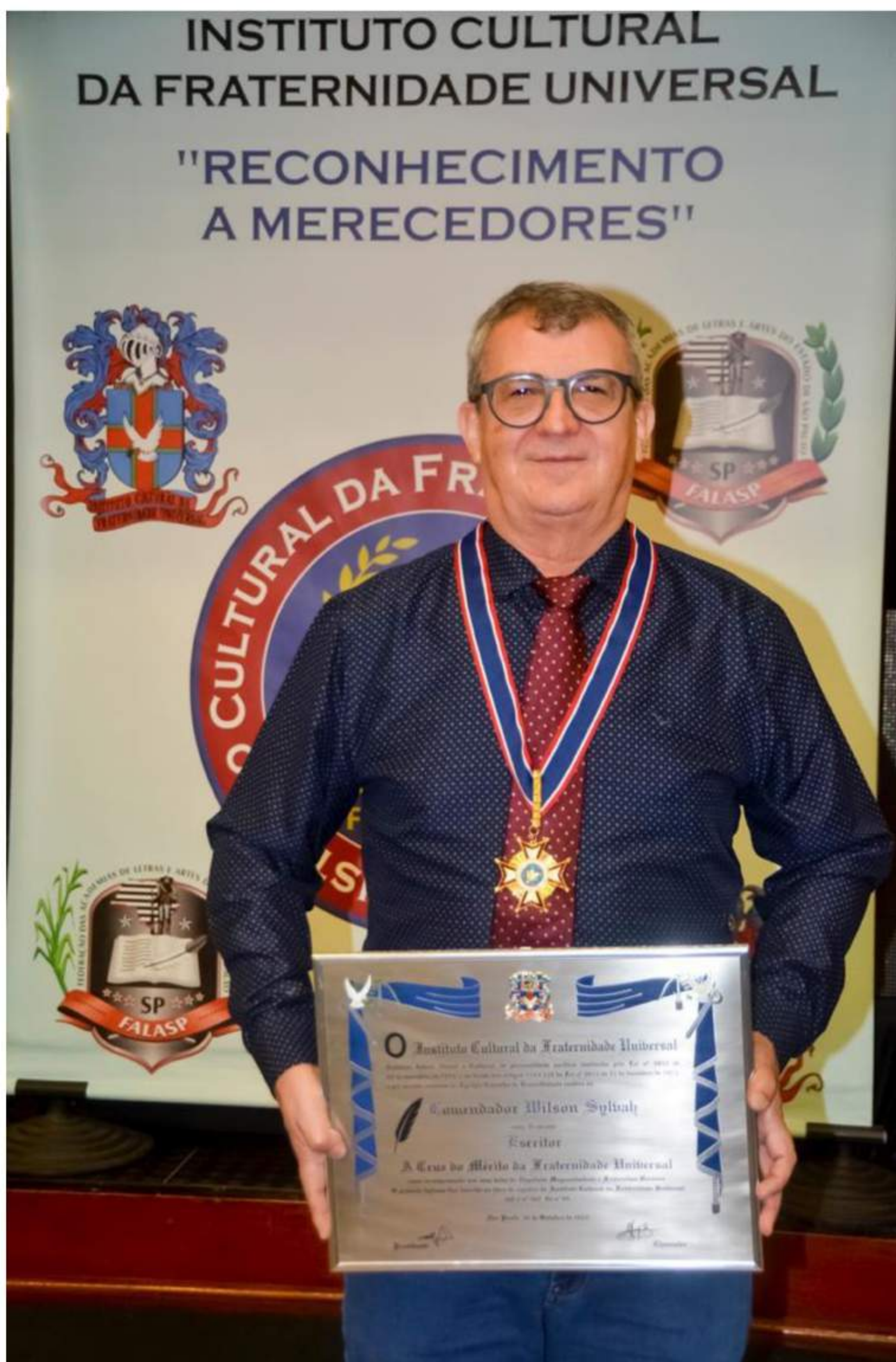
Chanceler das Artes Brasil-Inglaterra